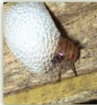
Ninfa de mosca pinta ( Aeneolamia postica ) y saliva

Formulación: Granulado. Concentración: 0.8% de imidacloprid, equivalente a 8 g de I.A./kg de Producto formulado. Categoría toxicológica: IV (Ligeramente tóxico). Presentación: Saco de 20 kg.