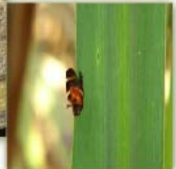
Adulto controlado por Jade